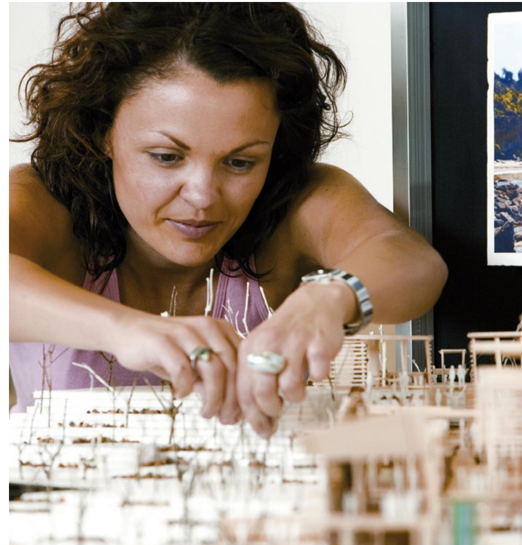
❖ Kreire Deine Umwelt: Neue Ideen und Inspirationen bei einem Auslandsstudium dafür finden!